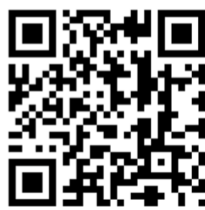
QR Code แจ้งซ่อมผ่าน Traffy fondue